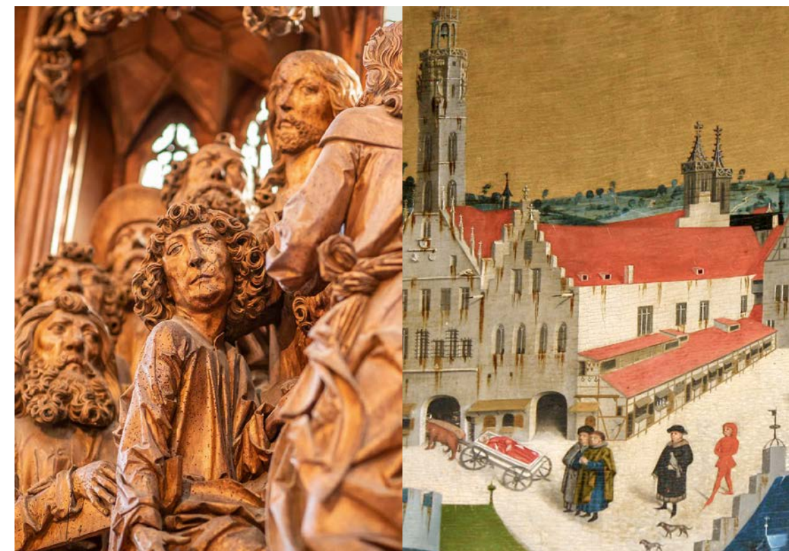
Tagung im Rathaus Rothenburg ob der Tauber, Ratssaal, 26. Oktober 2024